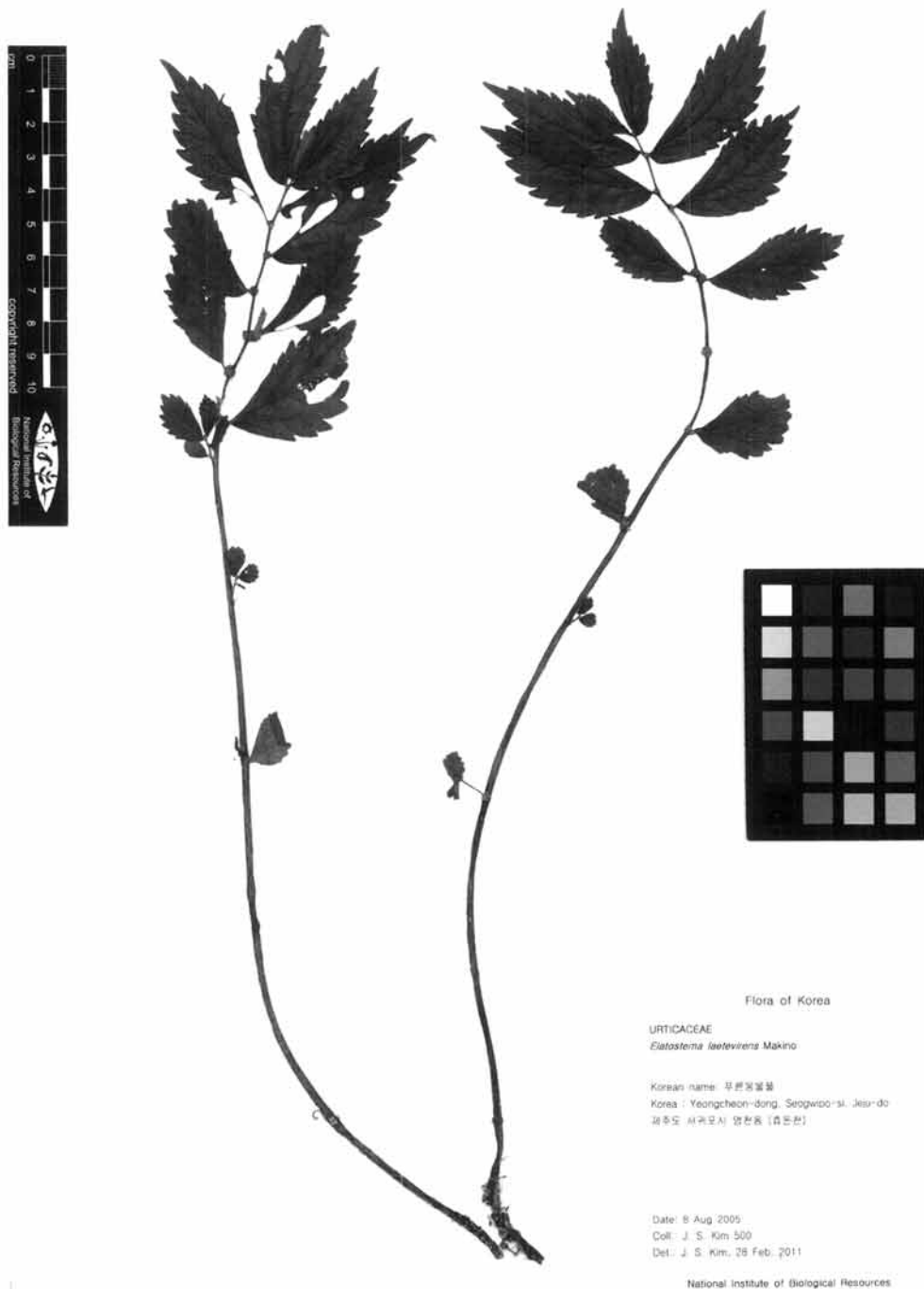
Fig. 1. An examined specimen of Elatostema laetevirens Makino.