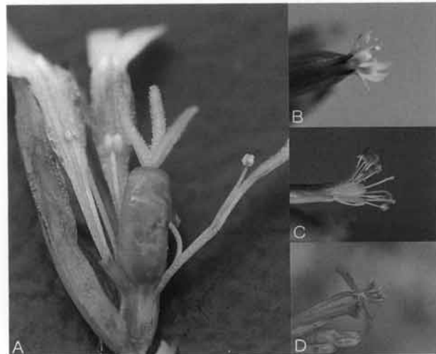
Fig. 2. Photographs of S. antirrhina L. (A, B), S. koreana Kom. (C), S. armeria L. (D). A. stamen, style and ovary; B. petal; C, D. petal, stamen and style.

S. antirrhina 의 한국명 '가는끈끈이장구채'는 다른 근연분류군들과 비교하여 실물의 크기가 소형으로 확연히 차이