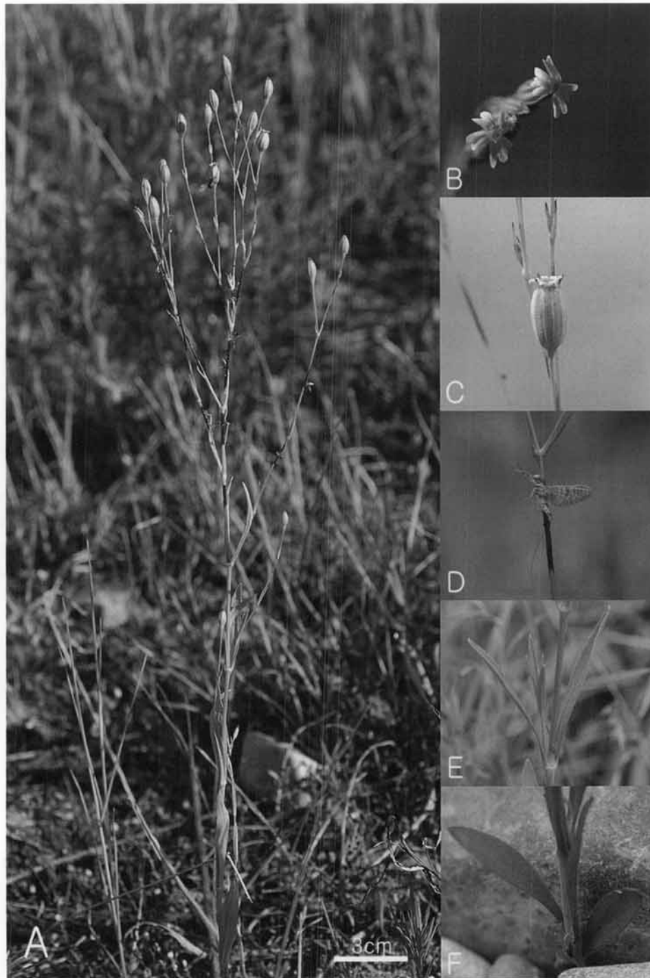
Fig. 1. Photographs of S. antirrhina L. A. Habit; B. Flower; C. Fruit; D. Dark glutinous areas; E. Cauline leaf; F. Radical leaf.

국명: 가는끈끈이장구채(Ga-neun-Kkeun-kkeun-i-jang-gu-chea, 국명 신칭)