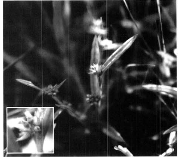
Fig. 1. Habitat and inflorescence of Scleria caricina (R.Br.) Bentham.

고찰: 본 종은 화서가 밀집되고, 화경이 거의 없이 액생하며(Fig 1), 수과는 항상 2개의 인편과 함께 탈락(Fig 2F)되는 특징에 의해 다른 한국산 너도고랭이속과 뚜렷이 구분된다(Koyama et al., 2000; Zhang et al., 2010). 국명은 식물체가 동속의 다른 분류군과는 달리 매우 소형인 점을 부각하여 애기개울미로 하였다. 이 식물은 2개의 막에 의해 수과가 둘러싸이는 특징에 의해 Scleria 속과는 다른 새로운 속으로 인식되어 Diplacrum caricinum R. Br.로 발표되었다(Brown, 1810). 이후 Bentham (1878)은 Brown이 제시한 형질은 Scleria 속 내의 다른 분류군과는 큰 차이를 보이는 형질이지만, 속 수준의