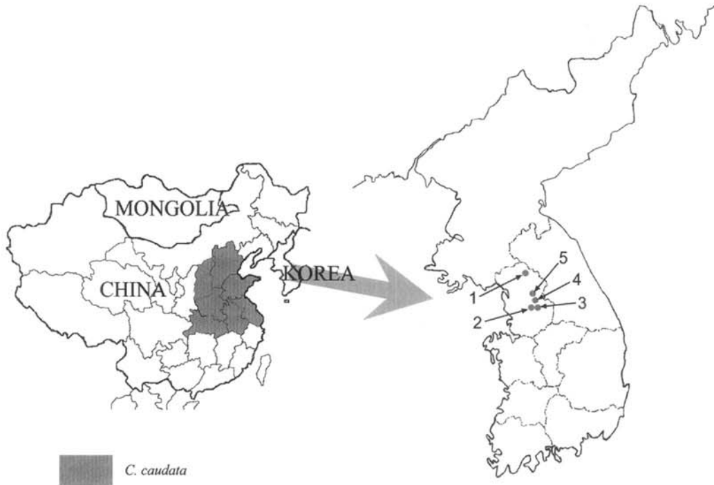
Fig. 2. Geographic distribution of C. caudata (Lam.) Pers. 1: Gyeonggi-do, Yeoncheon-si, Jijangbong, 2: Gyeonggi-do, Hanam-si, Namhansansung, 3: Gyeonggi-do, Gwangju-si, Yaengjabong, 4: Gyeonggi-do, Yangpyeong-gun, Nojeokbong, 5: Gyeonggi-do, Namyangju-si, Cheonmasan.