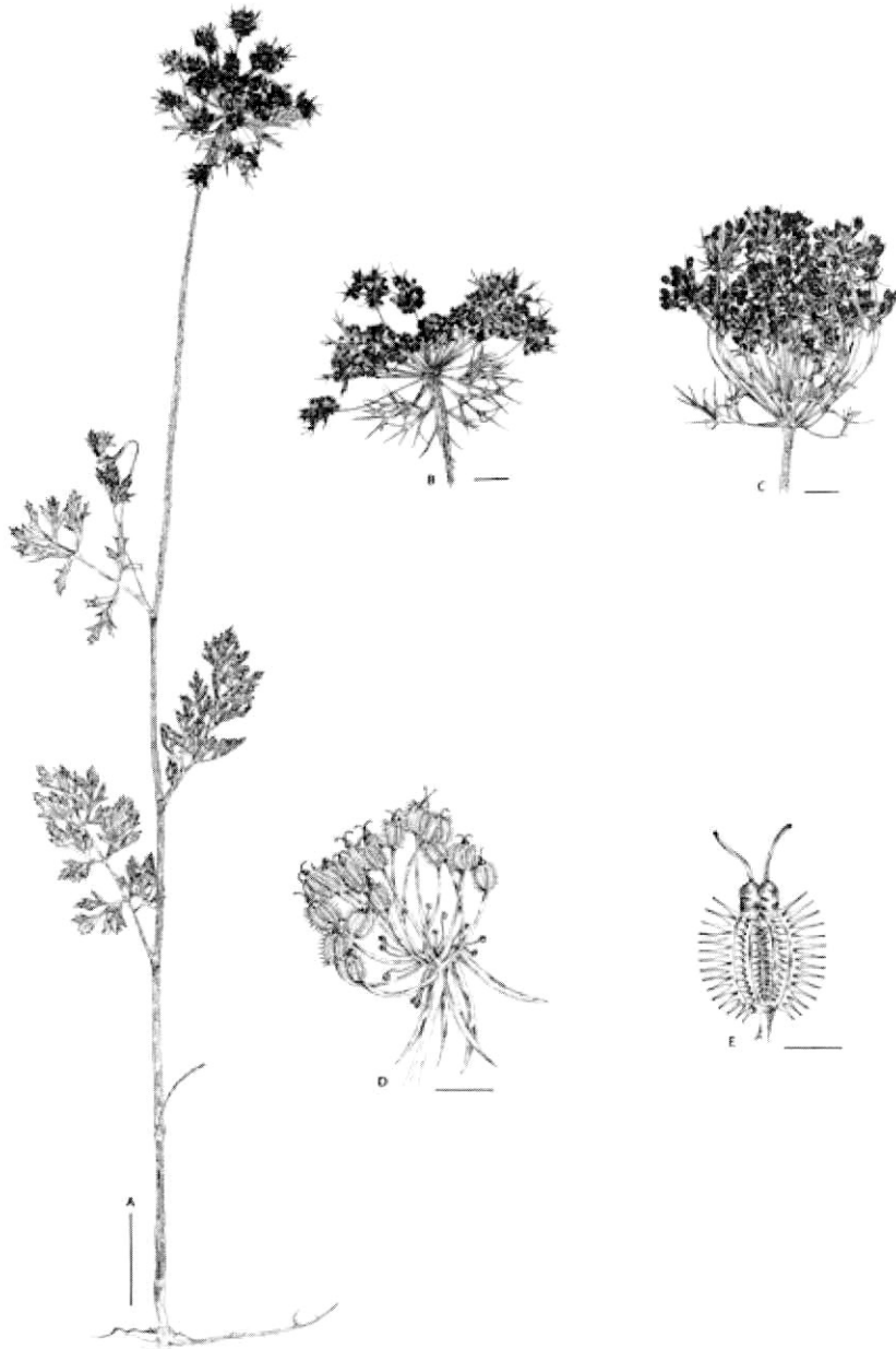
Fig. 2. Daucus carota subsp. maritimus (Lam.) Batt. A. Habit, B. Inflorescence in flowering, C. Inflorescence after anthesis, D. Individual umbels, E. Fruit. Scale bars: A = 5 cm, B-D = 1 cm, E = 1 mm.