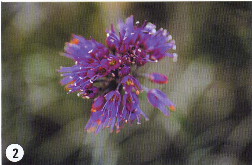
Fig 2. Photographs of Allium longistylum in Korea. 1. General view in habitat 2. Enlarged umbellate flowers.